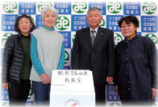
さつま町女性団体連絡協議会様