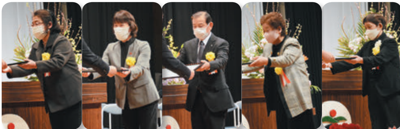
↑ 町民大会での社会福祉事業功労賞表彰

発行・編集 さつま町宮之城屋地2117-1(宮之城ひまわり館内) TEL 0996-52-1123 FAX 0996-52-1148