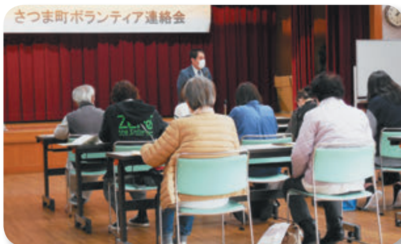
→ ボランティア連絡会