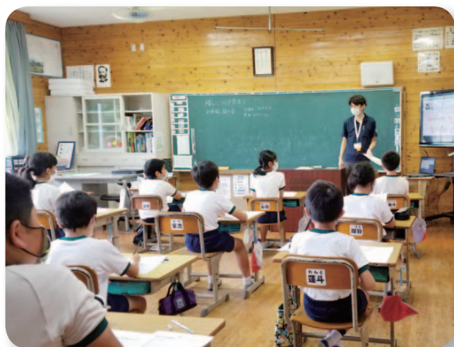
↑ 鶴田小学校4年生総合的学習