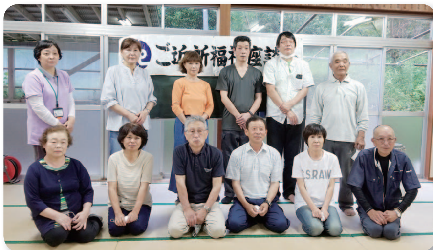
↑ ↓ 柵野区支え合いマップづくり

発行・編集 さつま町宮之城屋地2117-1(宮之城ひまわり館内) TEL 0996-52-1123 FAX 0996-52-1148